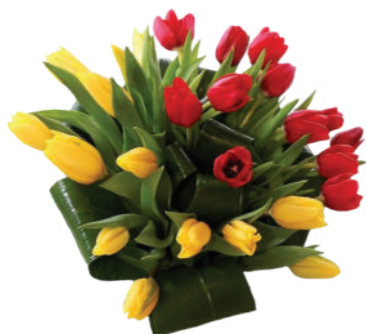
С любовью, дочь, зять и внуки

Папа, от души желаем Счастья, мира и добра! Живи, невзгод не зная, И не считай свои года! Здоровья, ярких дней, успеха, Свершений новых и побед, Побольше поводов для смеха И много светлых, долгих лет!