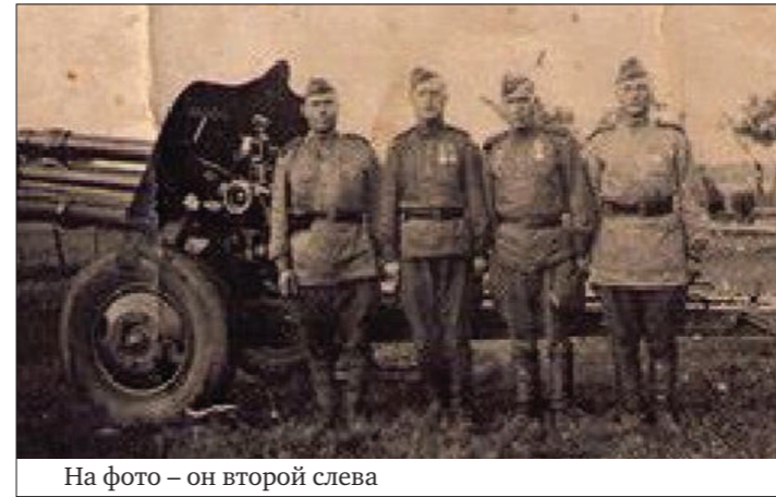
На фото – он второй слева

– День Победы – это святыня. За неё потерял здоровье мой отец, погиб мой брат. Я 26 лет защищал её в рядах РВСН.