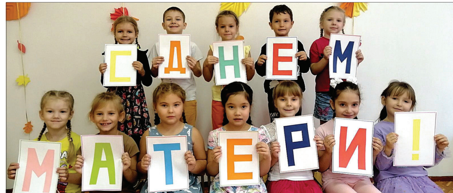
«Из двух слогов – простое слово «мама»... И нет на свете слов дороже, чем оно». Дети подготовительной группы «Совушки» поздравляют своих любимых мамочек с праздником!

– Берегите мам, всегда найдите время позвонить, выслушать, приехать, обнять... пока мамы с вами и пока вы – сыновья и дочери!